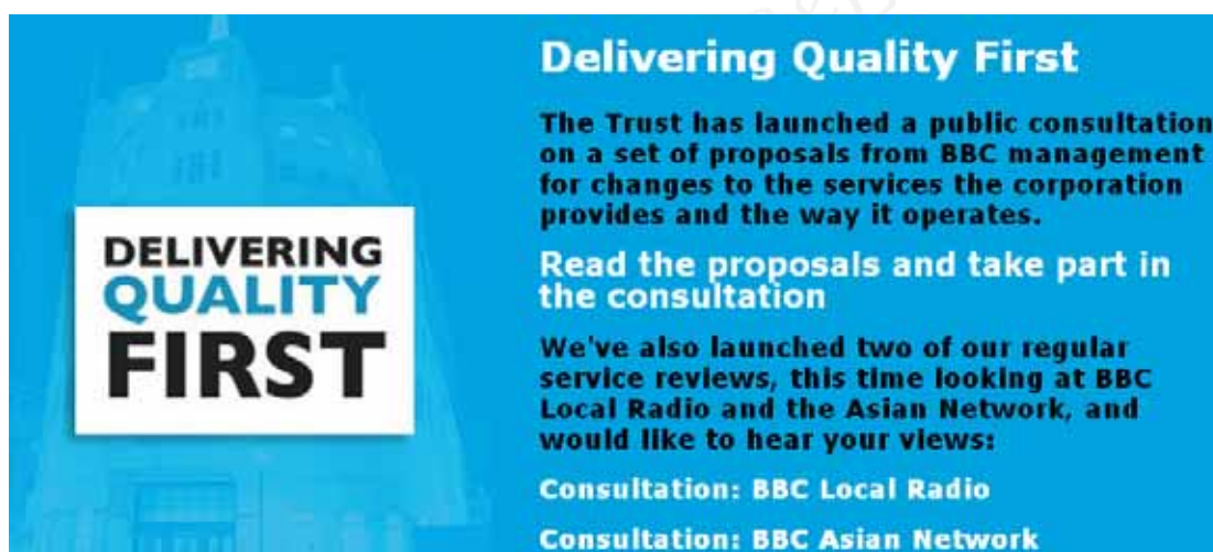
圖一：BBC公佈DFQ報告

2010 年 10 月，英國政府宣佈將在未來 6 年內凍漲 BBC 執照費，使執照費維持在每人每年 145.5 英鎊的水平，這使得 BBC 每年減少約 3 億 4 千萬英鎊的營收。除此之外，縮編後的預算還得同時支應 BBC Worlds Service、S4C，及 BBC Monitoring 的營運費用。對此，前任 BBC Trust 董事長 Sir Michael Lyons 在 2011 年 1 月 12 日致信 BBC 總經理 Mark Thompson，希望 BBC 團隊除仍須維持 BBC 節目品質，也須對新執照費費率擬定營運對策。同年 10 月，BBC 遞交精實方案，其中最引人側目的一項規劃，便是 BBC 計畫在 2017 年以前裁員 2000 餘人。