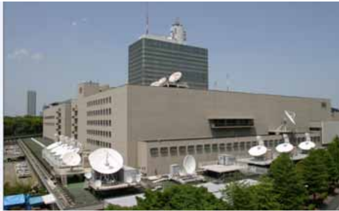
圖 1：NHK 總部一角，約攝於 2007 年。

NHK 在 1989 年 6 月開始正式播出 BS1 與 BS2 兩個類比衛星頻道。1994 年 11 月至 2000 年 11 月透過編號 BSAT-1a 的廣播衛星，NHK 與民間商業台共同進行類比高畫質衛星電視的試播。2000 年 12 月起，透過編號 BSAT-1b 廣播衛星，NHK 與民間商業台開始了數位衛星廣播，著名的 BShi 頻道在此時開播。2000 年日本的數位衛星廣播開播後，商業台的類比高畫質衛星頻道先行停播；2000 年-2007 年作為數位廣播觀察期，在此期間 NHK 繼續播出類比高畫質衛星廣播至 2007 年 9 月 30 日 BSAT-1a 廣播衛星停止使用為止。目前 NHK 共有 5 個衛星頻道，當中 2 個是類比訊號播出，稱為類比 BS 1 與類比 BS 2，另外 3 個是數位衛星頻道，分別叫做數位 BS 1、數位 BS 2 以及數位 BS hi；其中類比 BS 1 與數位 BS 1 播出內容相同，類比 BS 2 與數位 BS 2 的播出內容相同，BS hi 頻道則全部是高畫質的節目播出，是 NHK 衛星廣播的招牌頻道。