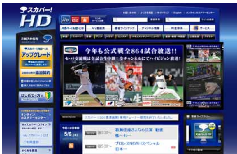
圖 4：Sky Perfect TV 網站首頁， http://www.skyperfecttv.co.jp/

在日本，1996 年被稱作數位衛星元年，同年 10 月 1 日 Perfect TV 成立，約有 70 個頻道，是日本最早的 CS 數位廣播。同年 12 月 17 日梅鐸集團與日本的軟體銀行（Soft Bank）合資成立 J Sky B，擁有 150 個數位衛星頻道。1998 年 5 月 1 日，Perfect TV 與 J Sky B 合併成立新公司，改名為 Sky Perfect TV；合併的結果，1998 年底訂戶突破 100 萬，成為 CS 衛星廣播的龍頭。Sky Perfect TV 同時使用位於東經 124 度的 JCSAT-4A 與位於東經 128 度的 JCSAT-3A 兩顆通信衛星提供衛星廣播；統合了包含 100% 外資在內的 90 家衛星電視業者，由於其頻道數眾多而且內容豐富，Sky Perfect TV 的營運遂逐步超越走在前頭的 WOWOW。《NHK 年鑑 2010》指出：Sky Perfect TV 的訂戶數 2005 年時達到 407 萬，2006 年達到 421 萬，2007 年 419 萬，2008 年 416 萬；顯示近年來訂戶數並無顯著的成長，基本上維持 400 萬戶上下的穩定經營。