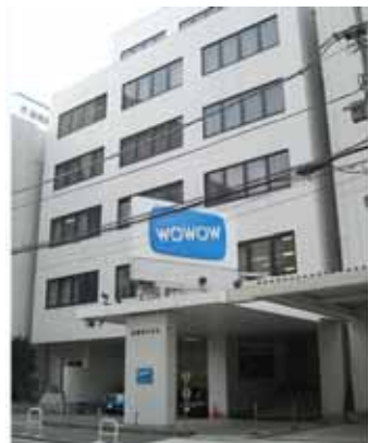
圖 3：位於東京的總公司