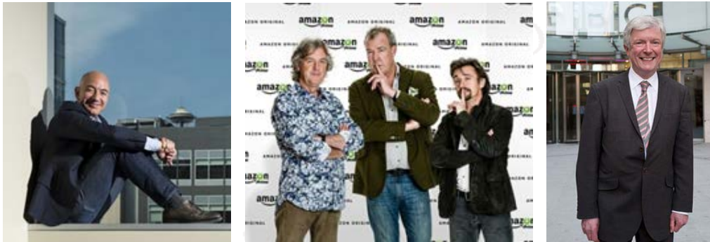
圖說：亞馬遜創辦人員佐斯（圖左）正式簽下前 BBC 王牌主持人 克拉松三人組（圖中），霍爾則是損失不小（圖右）。