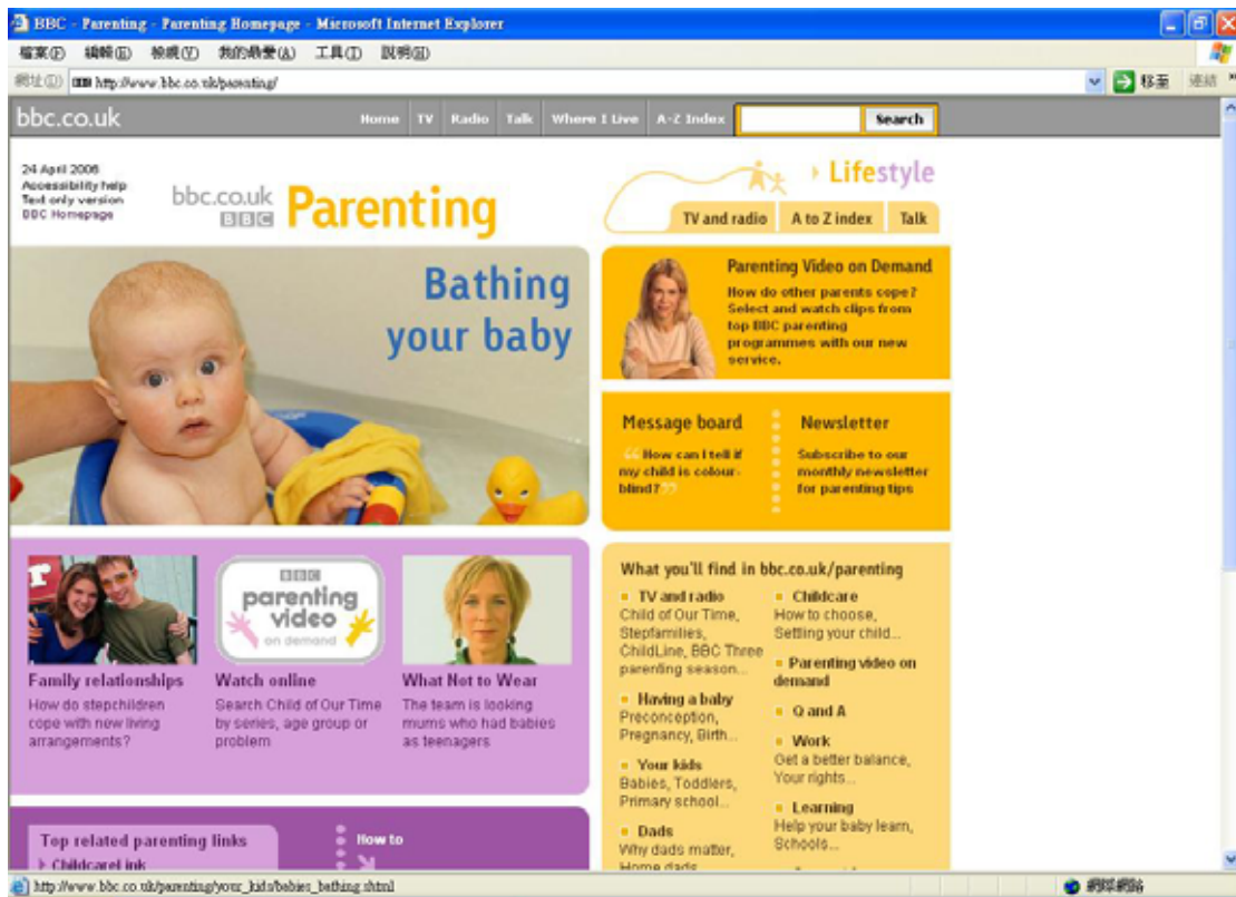
圖一：BBC 教養網站 Parenting 提供豐富的教養資訊