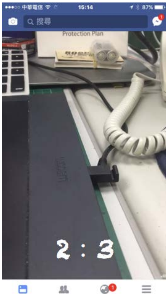
動態牆模式下的影音畫面

以手機版為例，在動態牆模式收看影片， Facebook 會以 2:3 的格式呈現影音畫面。從下圖可知，在動態牆模式下出現的影片，上下方會有 Facebook 的搜尋框與狀態列。