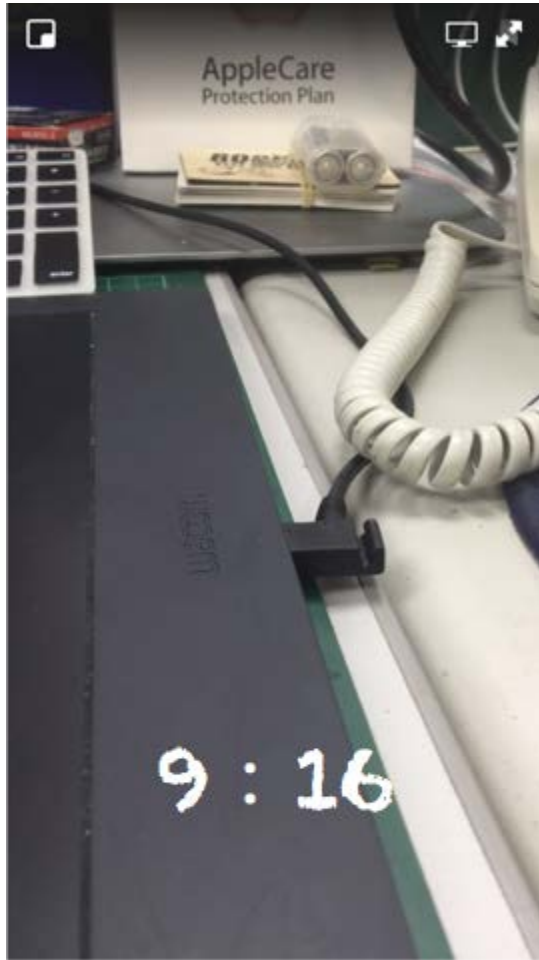
全螢幕模式下的影音畫面

因此我們建議在編輯影音時，可將上下的搜尋列與狀態列視為影音畫面的安全框，以保證影像視覺中心的物件不被遮蔽。